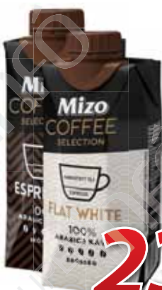
Mizo Coffee 330 ml, több íz, Sole-Mizo