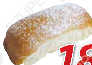
Izes bukta 100 g, Zombor Cípő Kft.