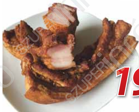
Sült császárszalonna 1 kg, Gulyás