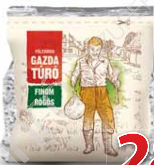
Gazda tehéntúró 250 g, Sole-Mizo