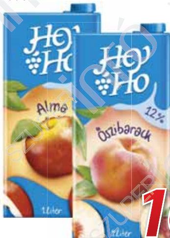
Hey-Ho üdítőital 1 liter, 12%, több íz, Rauch