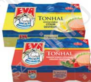
Eva tonhal 2x80 g, növényi olajban, több íz, Podravka