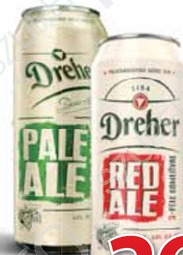
Dreher Red Ale, Pale Ale 0,5 liter, Dreher