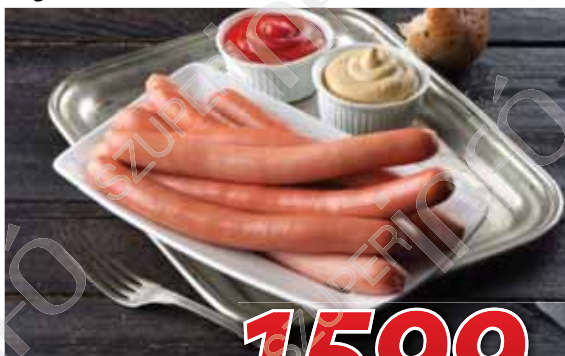
Nádudvari sertés roppanós virsli 1 kg, Nádudvari Élelmiszer Kft.